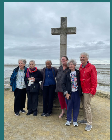
Peregrinación a Noirmoutier