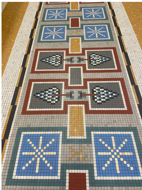
Suelo de la sala Eau Vive