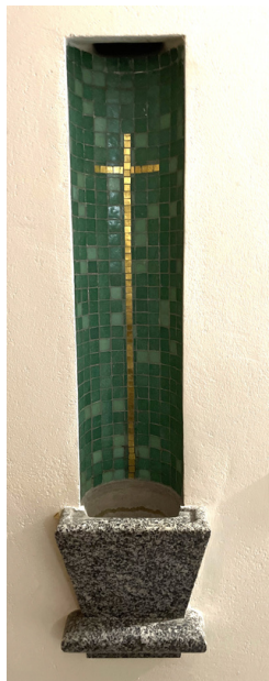
Pileta a la entrada de la capilla