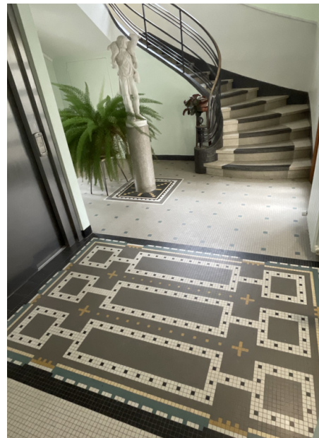
Patio del 1er piso del edificio de la capilla

El Museo abre los viernes, sábados y domingos de 14 a 17 horas. Los grupos son bienvenidos durante toda la semana, previa solicitud.