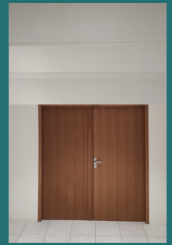
Entrada del museo antes de las obras

encima de la puerta de madera, que recuerda la parte acristalada de la "puerta verde" de la calle Brault, y las letras en relieve "Musée du Bon Pasteur".