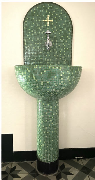
Lavamanos a la entrada del oratorio