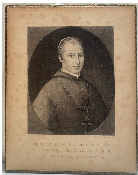
Retrato del Cardenal Carlo Odescalchi, 13x10.5 cm, Sala de los Obispos en el Museo.

El 15 de agosto de 1834, durante las Vísperas de la Asunción, Santa María Eufrosia tuvo la intuición de escribir a Roma para exponer sus planes para el Generalato.