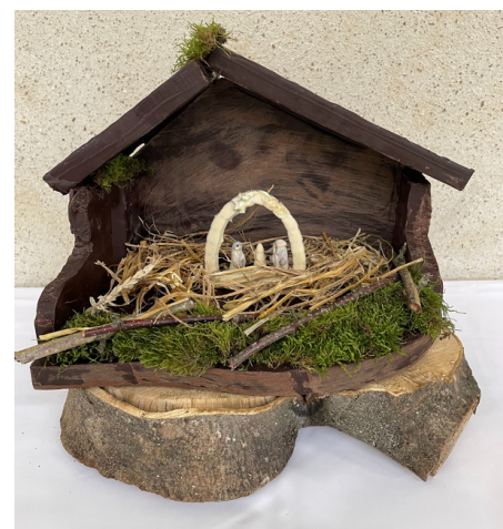
Pesebre de chocolate. Una creación del restaurante "Le Tournemine".

Muchas gracias también al equipo de Le Tournemine, el restaurante de la Hostelería del Buen Pastor, que creó un pesebre 100% de chocolate para la exposición.